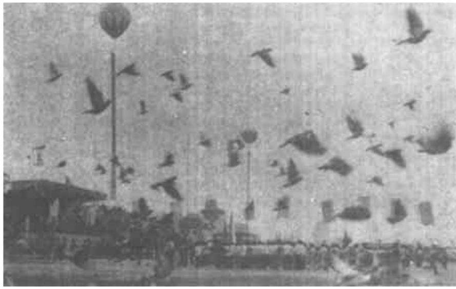
市五运会开幕式掠影

冷,录取的考生多为调剂志愿。 初中中专招生呈现两大特点:一是录取管理工作更为严格集中。今年整个录取工作采取统一时间、统一地点、统一政策、统一管理的办法,全部用微机调剂;二是师范、卫生类生源看好,大多数学校一、二志愿就基本录满,而供销、粮食、化工类学校相对较冷。通过今年的初中中专录取看到存在两个较为严重的问题:一是男女考生比例严重失调,女生约占考生总数的70%左右,这不仅给录取工作带来麻烦,也给考生将来的就业及高中阶段的教育工作带来诸多影响;二是考生志愿较为集中,大多数考生志愿集中在邮电、电力、工商等少数所谓的热门学校,导致此类学校竞争激烈,大多数考生被迫调剂志愿。 (刘连杰)