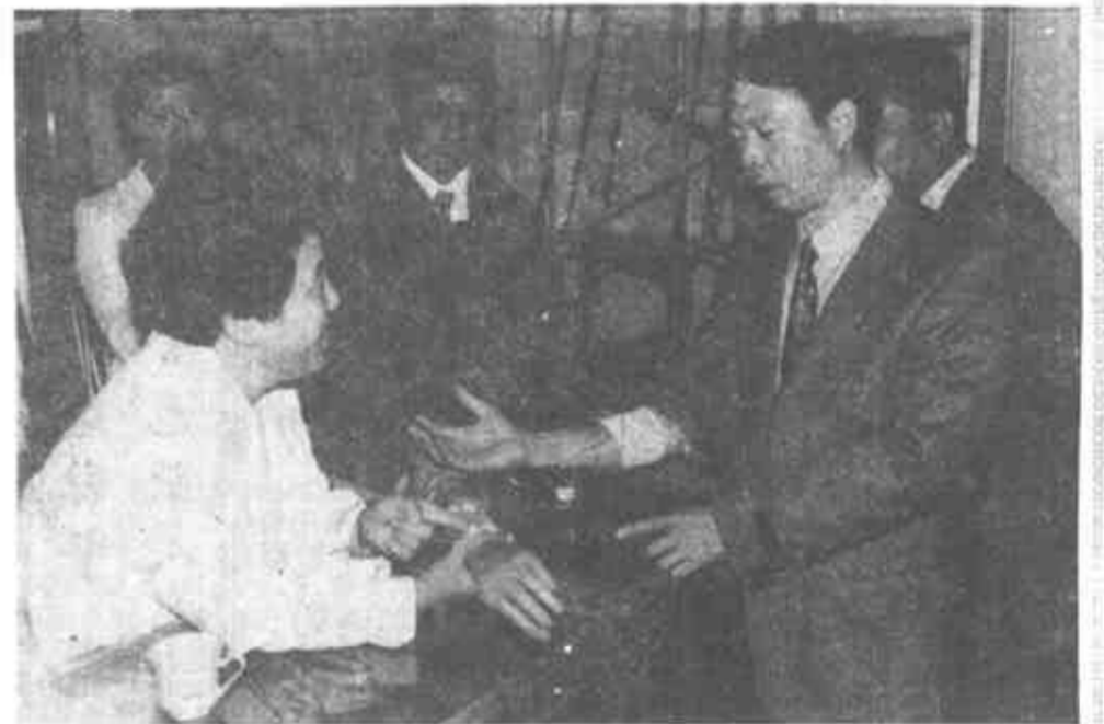
“高、精、尖”的假肢应用表演,引起专家们的浓厚兴趣。